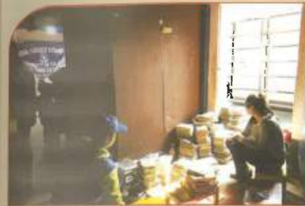
▲ Students' active participation