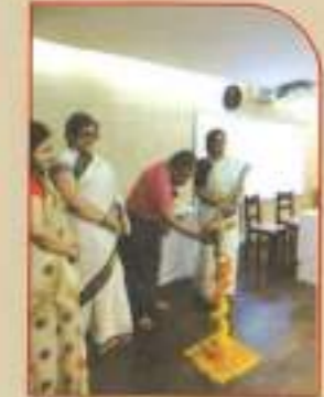
▲ Inauguration of the programme by lighting of lamp by Honourable Guest Dr Swapan Kumar Chakravorty