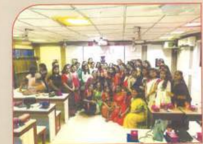
▲ P.G. English Farewell