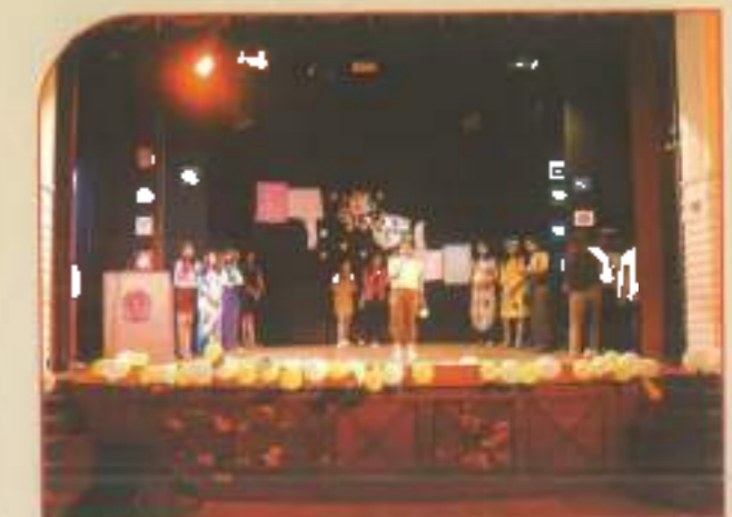
▲ B.COM (morning) freshers' welcome 2018