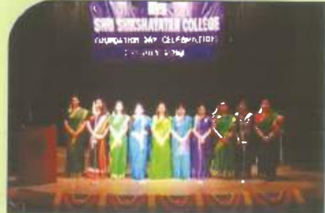
Celebrating Teachers' Day