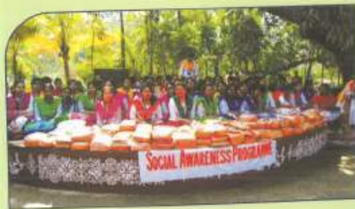
◀ Students of the B.Ed Department at Khelaghor Badu, Madhyamgram.