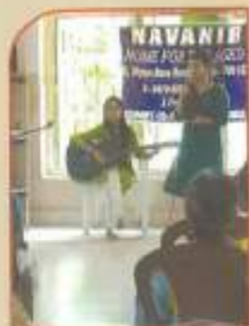
▲ Visit to Navanir