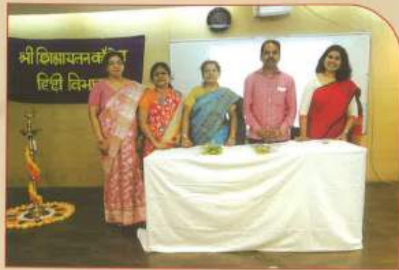
◀ Honourable guests on the occasion of Hindi Diwas.