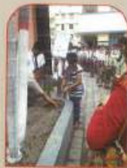
▲ SSC LTSer planting saplings on forset week celebration