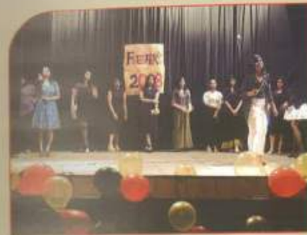
▲ B.Com (Evening) freshers' welcome