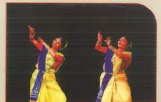
▲ Students' performance