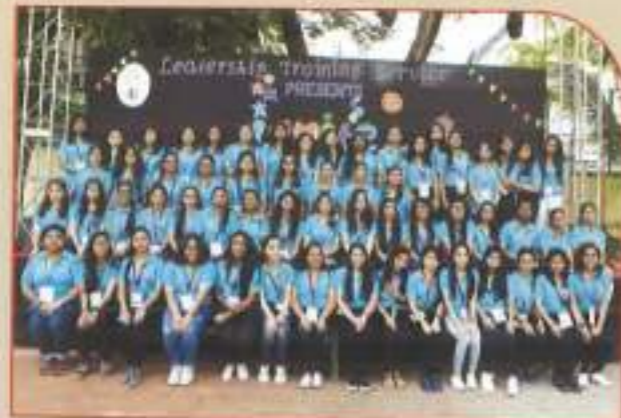
▲ SSC LTS volunteers for Ignite 6