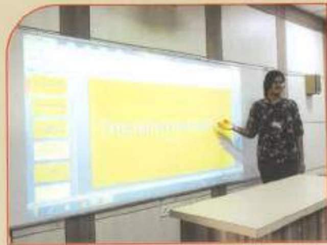
◀ Students' presentation