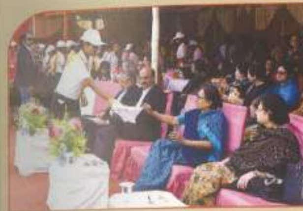
◀ Sports meet