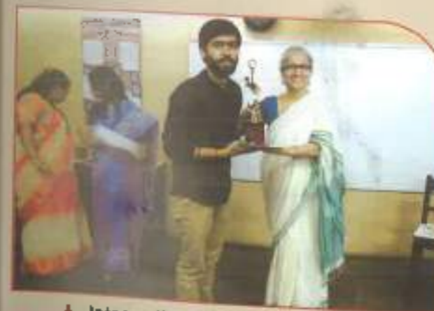
▲ Inter-college competition and prize distribution ceremony