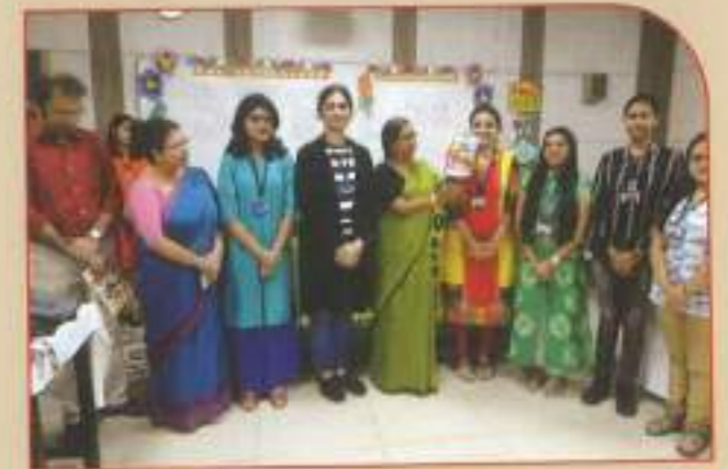
▶ Inauguration of Students' Magazine, Brewing Minds