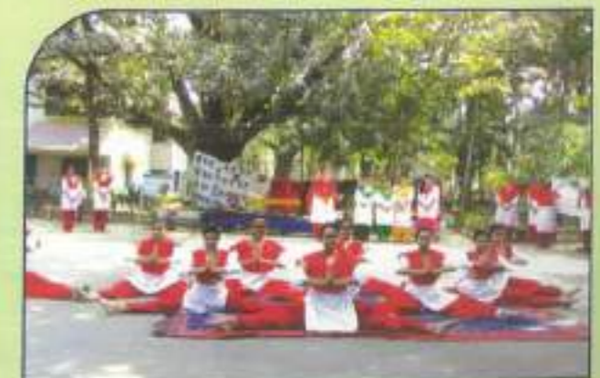
▶ Students of the B.Ed Department performing at Khelaghor, Badu, Madhyamgram