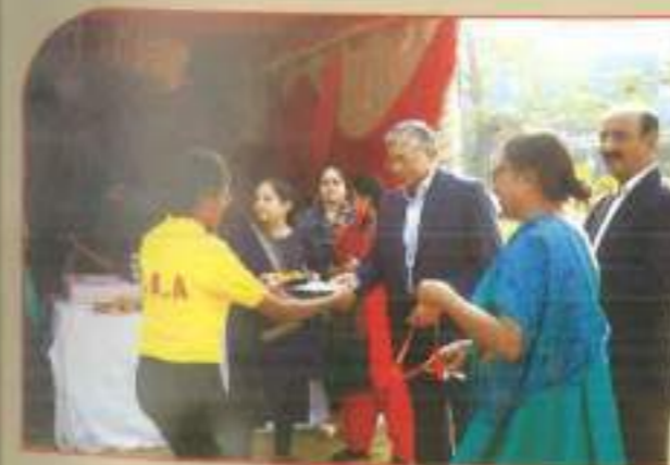
◀ Prize Distribution Ceremony