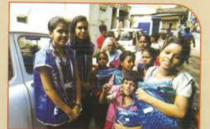
▲ NSS activities at the Tyagra alum