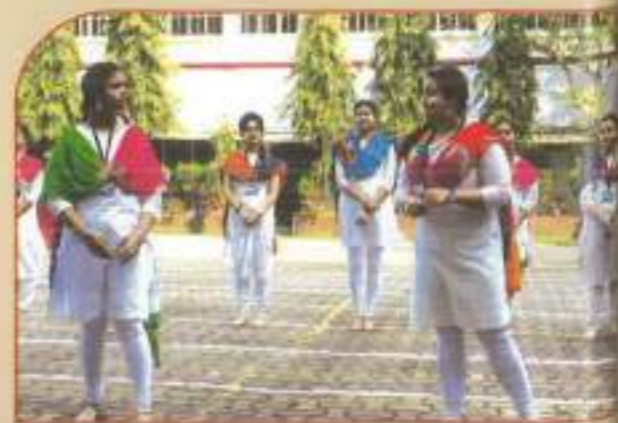
▲ Republic Day 2019 Drama Performance titled AWAKENING INDIA