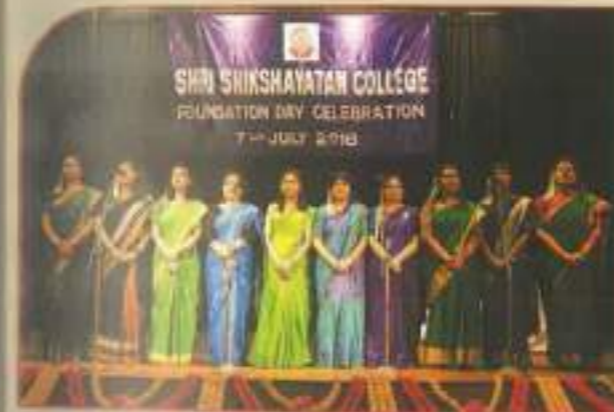
▲ Inaugural song by the students