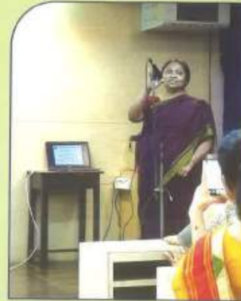
Co-ordinator of B.Ed Department addressing the B.Ed students, batch of 2018-2020 on the Orientation Day

অবশেষে, কিছু বলতে পারল না সে। সে চোখ বন্ধ করে। রাফল তার মাথায় সিঁদুর পড়িয়ে দিল। এ সব বিছুর মধ্যে তিতাস বুঝে গেল তার জীবনের প্রসেল পরীক্ষা আজ থেকে শুরু। কখনার জগৎ ও বাস্তবের তফাৎটা এই কয়েক মুহূর্তের মধ্যেই সে বুঝে গেল। সে ভাবল যে করেই হোক তাকে এই পরীক্ষায় উত্তীর্ণ হতে হবে। মা বাবার আনুগে ছোট মেয়েটি আজ নিজের স্বজা তেই এক বড় হয়ে গেল। তার ভালোবাসার অরিপরীক্ষ' আজ থেকে শুরু।