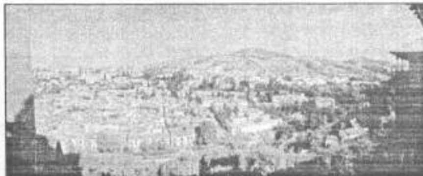
Nazrid Palace, Alhambra (L-R)