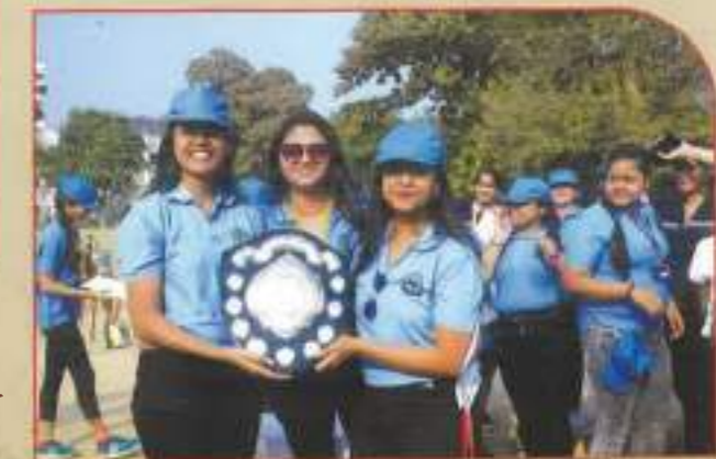
▶ Winning Team B.COM