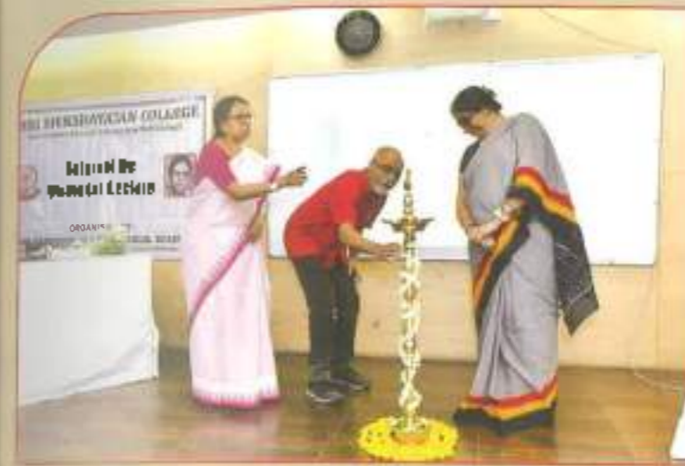
◀ Inauguration by honourable guest