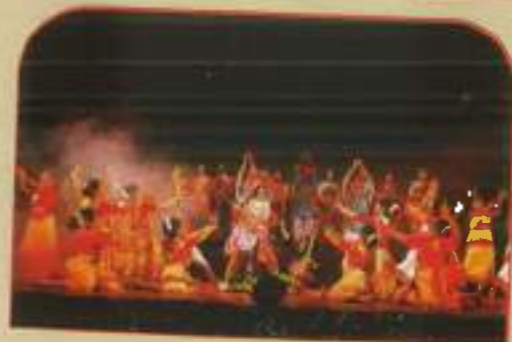
◀ Colours of Bengal, Music & Dance Recital