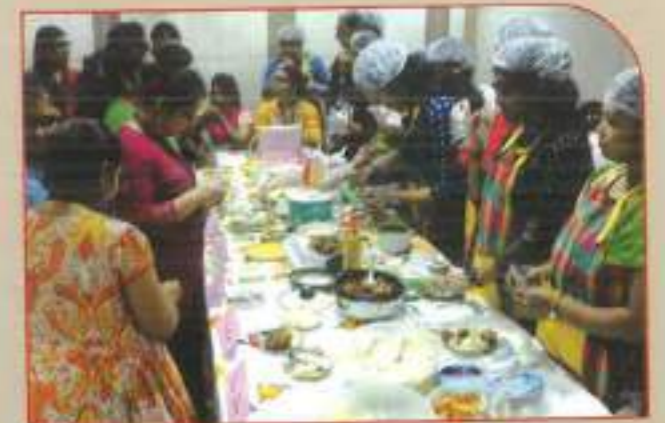
▶ Food Stall