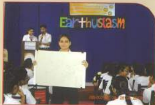
▲ Earthusiasm 2019