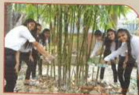
▲ E- Panaroma