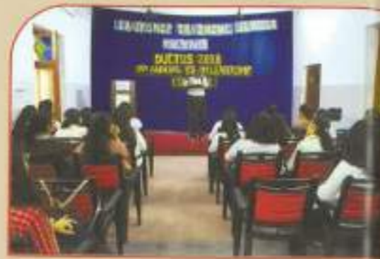
▲ Ductus 2018 (Youth Leadership Conclave)