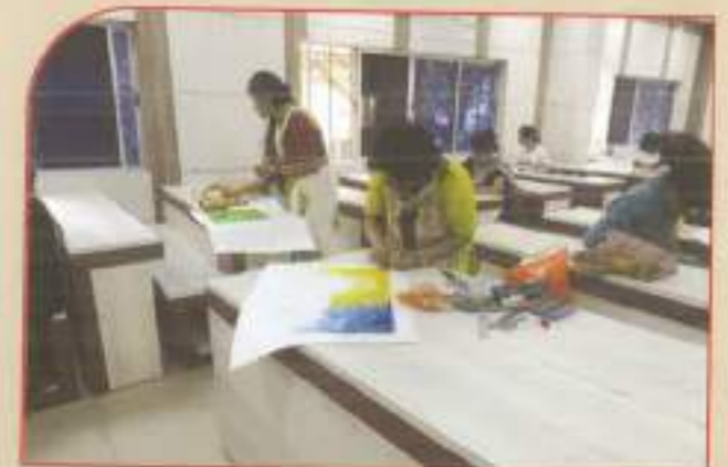
▲ Bhasa Divas competition