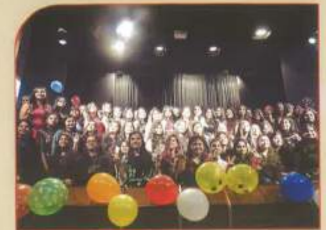
▲ BBA freshers' welcome