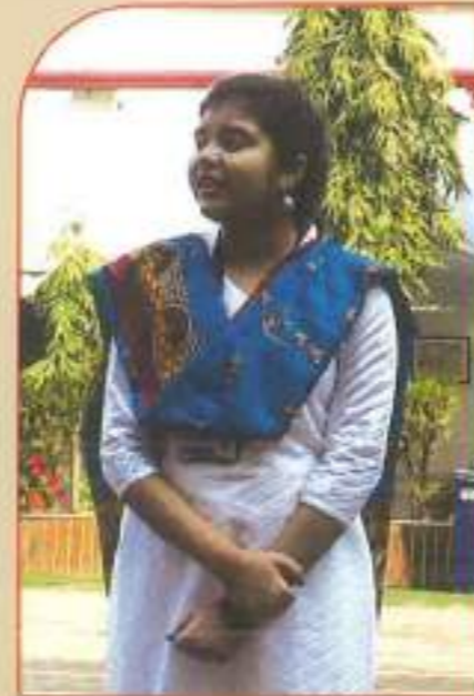
▲ Republic Day Programme 2019