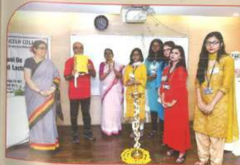
◀ Release of "Perception", departmental journal of Political Science.