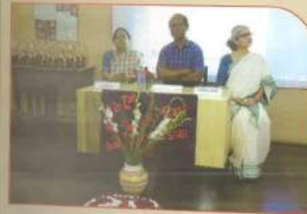
▲ Bhasa Divas Programme