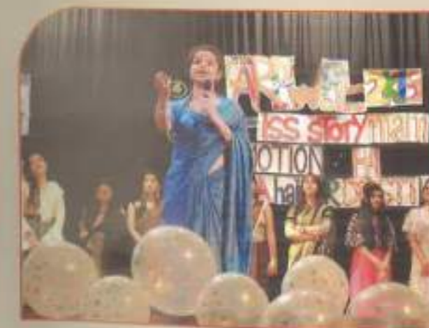
▲ B.COM (M) Miss Shikshayatan 2019 showcasing her talent