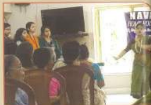
▲ Visit to Navanir