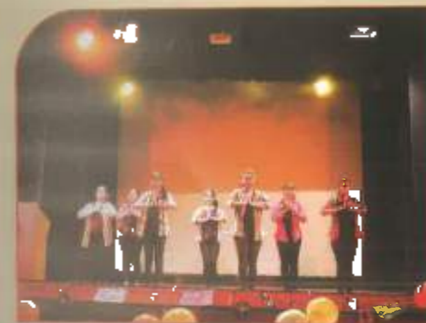
▲ B.A. / B.SC Freshers' Welcome