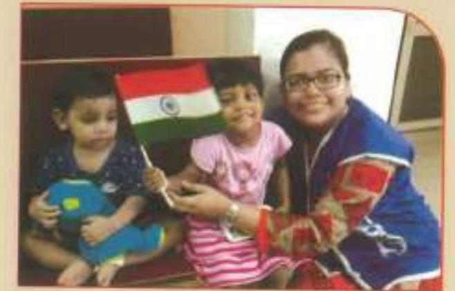
▲ Student Volunteer