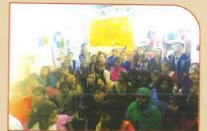
▲ NSS Special Camp