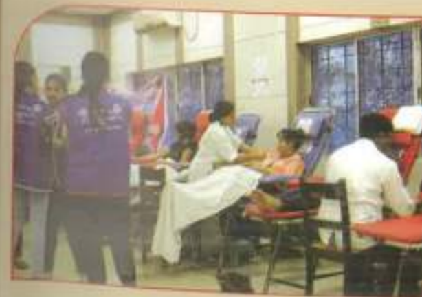
▲ NSS health camp