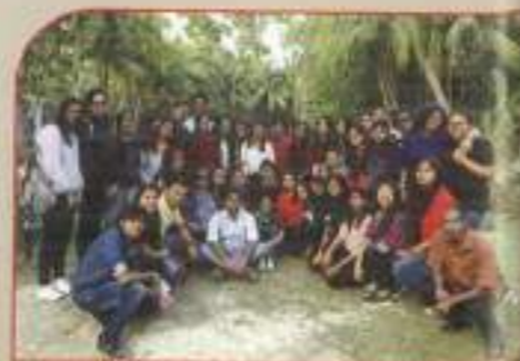
▲ LTS picnic 2019