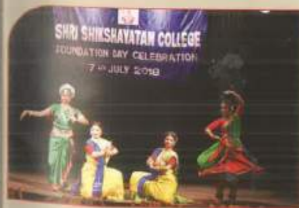
▲ Dance recital