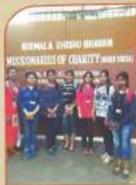
▲ Visit to Nirmala Shishu Bhavan