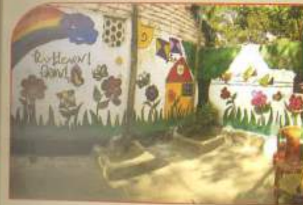
▲ Play learn and grow