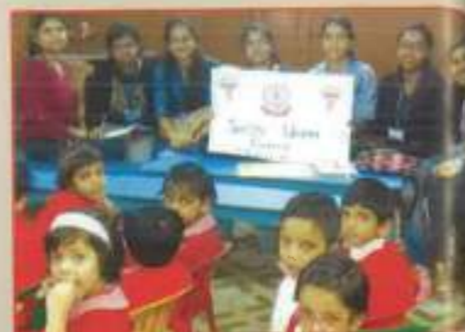
▲ At the health camp organised by All India And Asthma Research Centre Kolkata