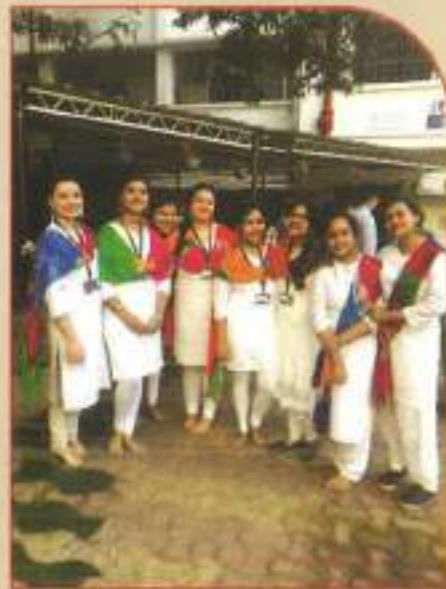
▲ The participants for the Republic Day Programme 2019