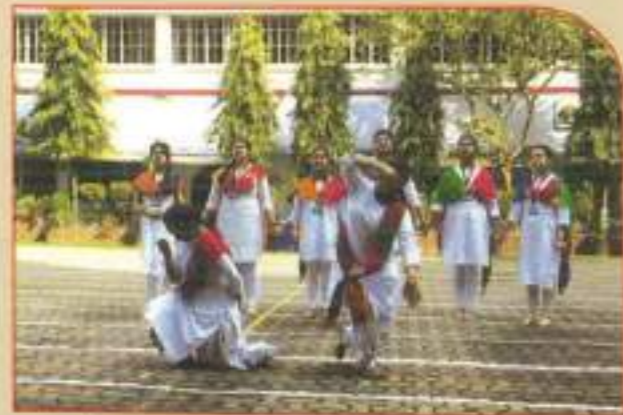
▲ Republic Day Programme 2019 titled AWAKENING INDIA