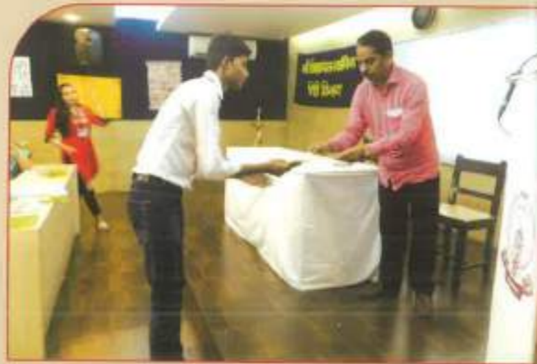
◀ Certificate distribution to participants