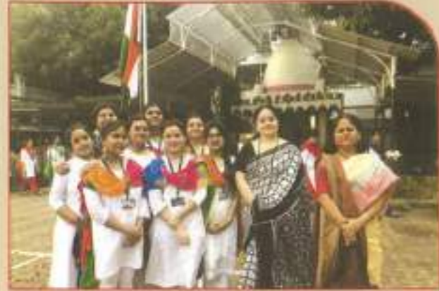
▲ Republic Day 2019