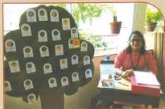
▲ Wish Tree Project