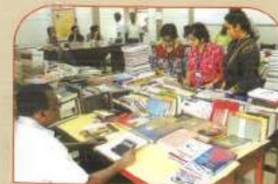
▲ SHRIGYAN 2018