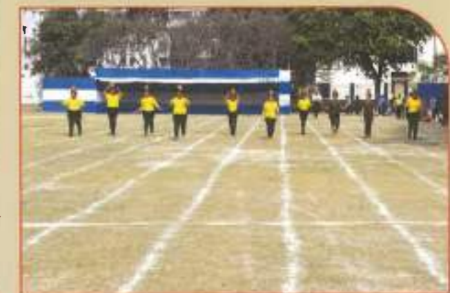
▶ Balance Race