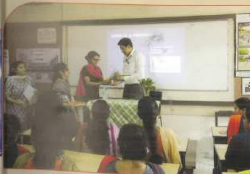
Dengue Awareness Programme