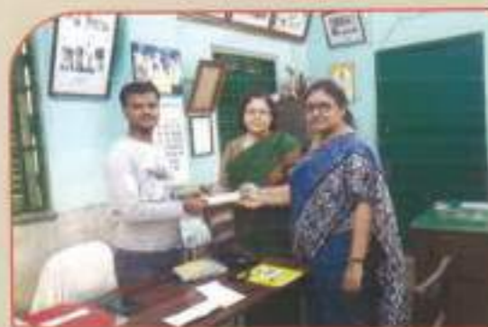
▲ Cheque being given to Dakshin Kalikata Sevashram