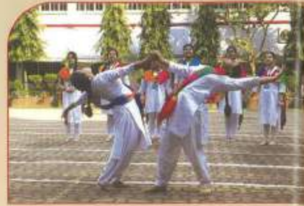
▲ Republic Day Programme 2019