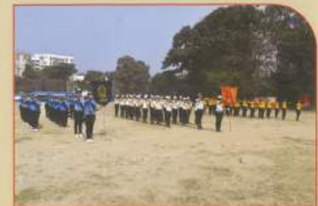
▶ March past of three streams