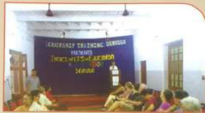
▲ Impact of LTS on education Australia India dialogue