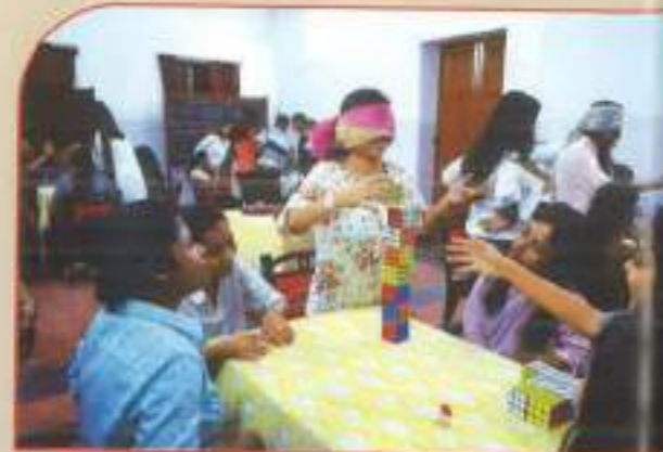
▲ Group activity - leadership building