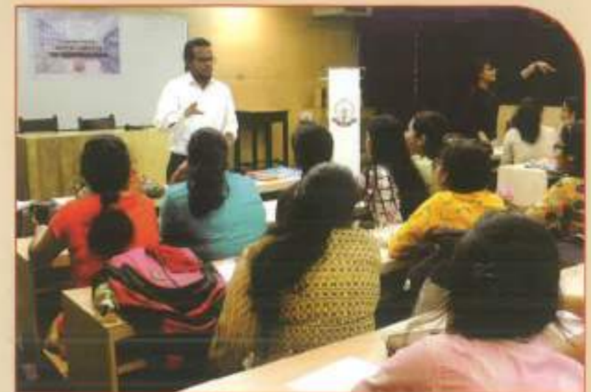
Mental Health Workshop