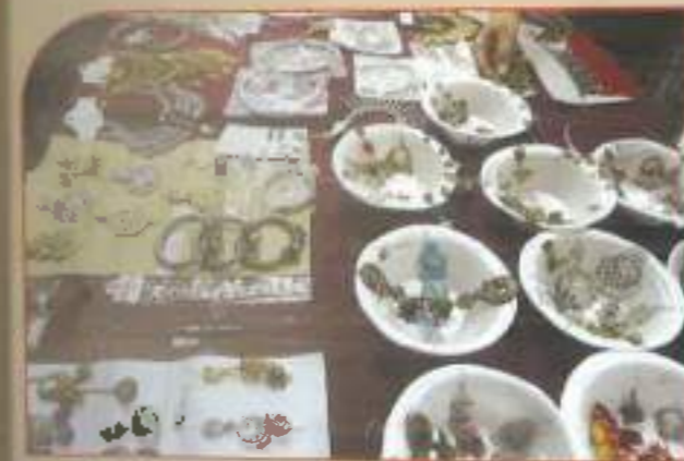
◀ Shree Exhibition