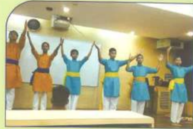
Students of the Pratibandi Kalyan Kendra performing on Orientation Day