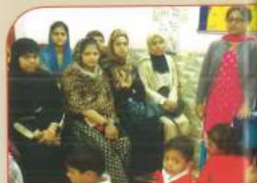
▲ Health Camp