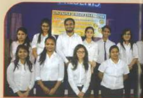
▲ LTSers who organised the Alumni meet.