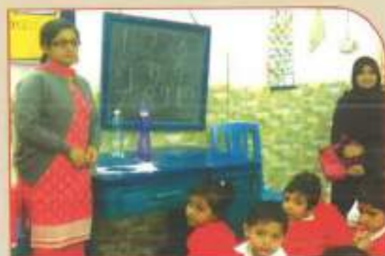
▲ Health Camp