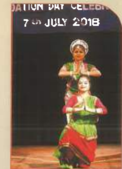
▲ Dance presentation by students