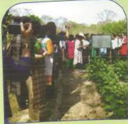
▲ Students and Faculty of the B.Ed Department at Murshidabad as a part of a Social Science Excursion